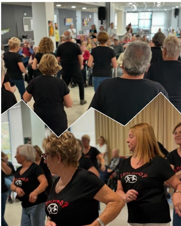
Ball en Línia "Esplai Buenos Aires"