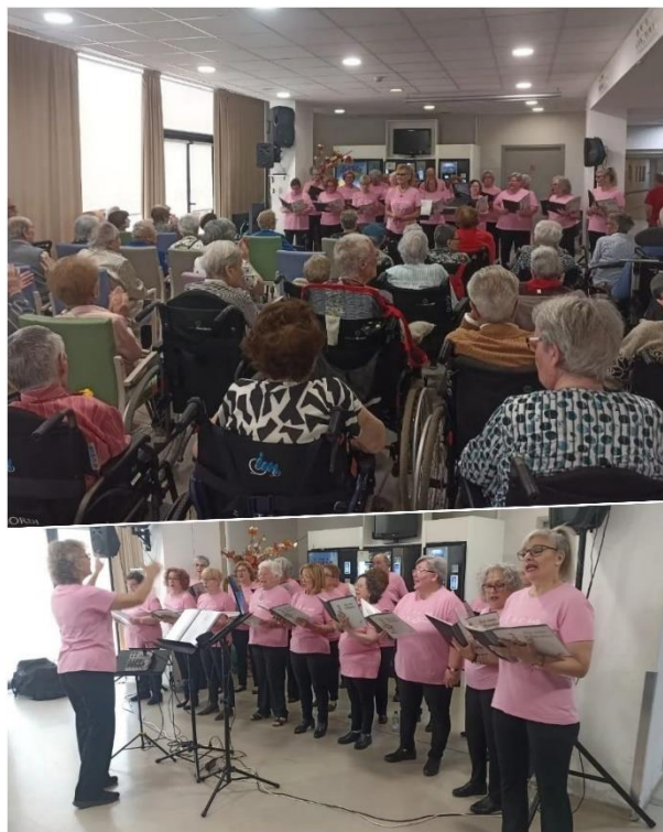
Coral "Les Veus d'Ariadna"