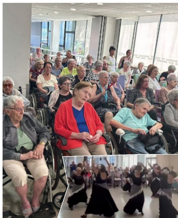
Sevillanes de "El Progrés"

També vam rebre la visita del duet musical "Entre Sol i Fa", que des de fa anys ens regalen les seves magnífiques actuacions.